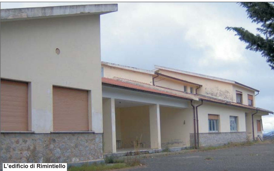
L'edificio di Rimintiello

il miglioramento della qualità della vita, sulle infrastrutture viarie, e sulla costruzione di scuole, giusto nelle campagne, per combatterne e contrastarne l'abbandono.