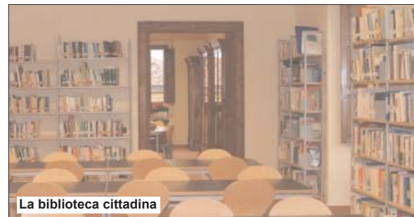
La biblioteca cittadina